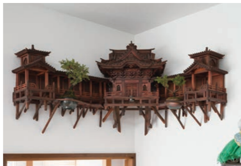
©Sanjo Butsudanx [me] / Photo by SHIMIZU KEN for CONFORT No.160